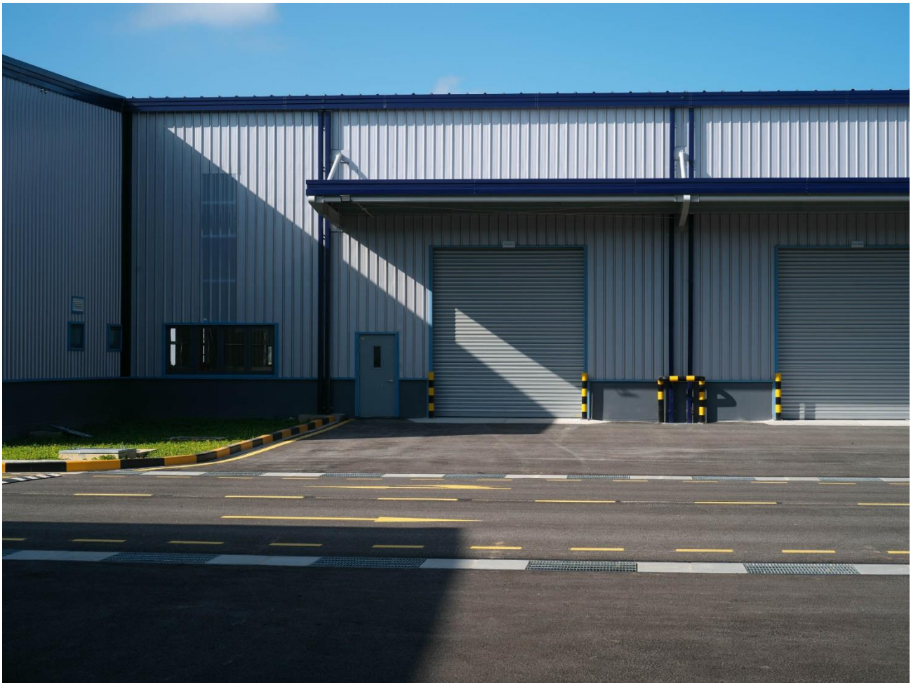
已建成的工业设施位于亭武-吉海经济区，地理位置优越，有望成为出口制造中心

南亭武工业园位于海防省亭武-吉海 (Dinh Vu – Cat Hai) 经济区，地理位置优越，港口设施非常完善，堪称外商对汽车、电子、可再生能源、电气设备和机械等行业进行直接制造投资的首选位置。截至今年 11 月，越南新登记的外商直接投资 (FDI) 项目金额超过了 164.1 亿美元，同比增长 42.4%，登记的外商直接投资总额同比增长近 15% 1 ，而海防在这一格局中脱颖而出。此外，亭武-吉海经济区还为制造商提供了极具吸引力的税收优惠政策，包括 4 年免征企业所得税和 9 年减半征收企业所得税。该新项目还通过四通八达的公路系统（包括河内 – 海防公路、下龙 – 海防公路和河内 – 海防高速公路）与越南北部其他省份及中国实现互联互通，方便了进出港口的货物运输，进一步增强了该项目对潜在制造商的吸引力。